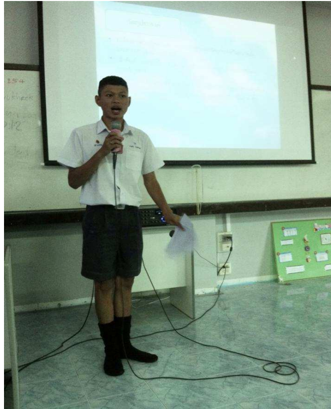
นำเสนอโครงการ