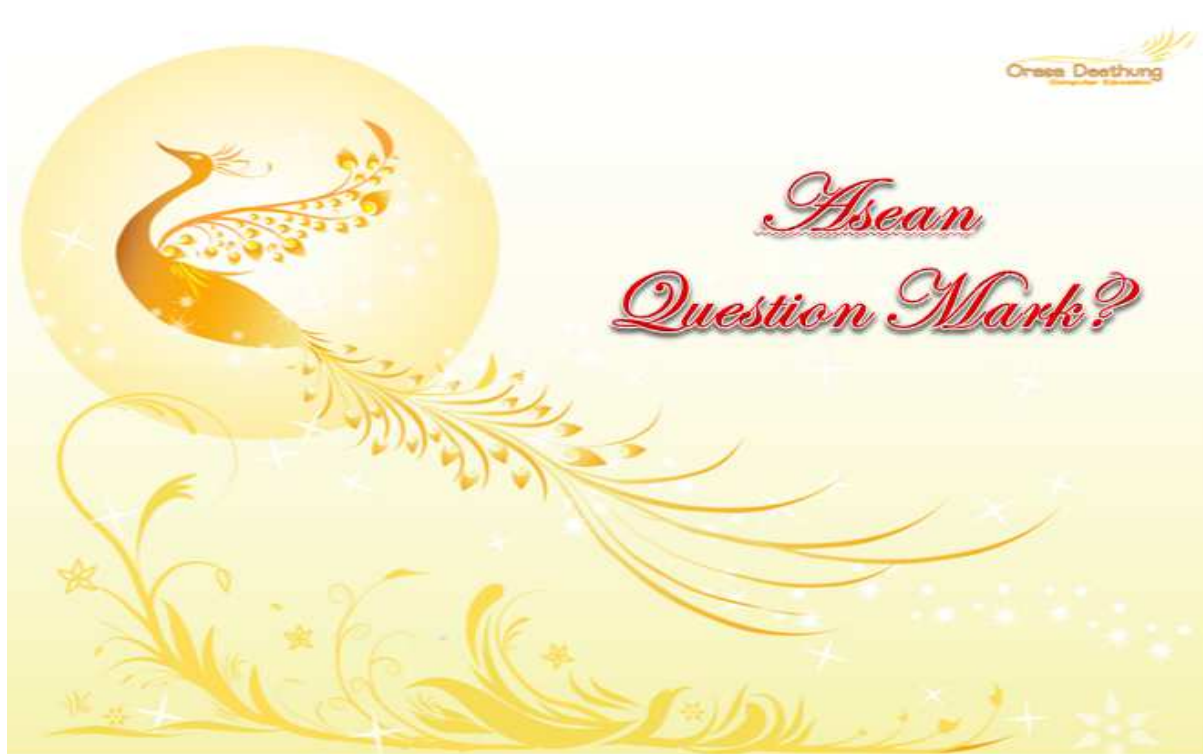
งานนำเสนอ เสนอโครงการ ASEAN QUESTION MARK ?