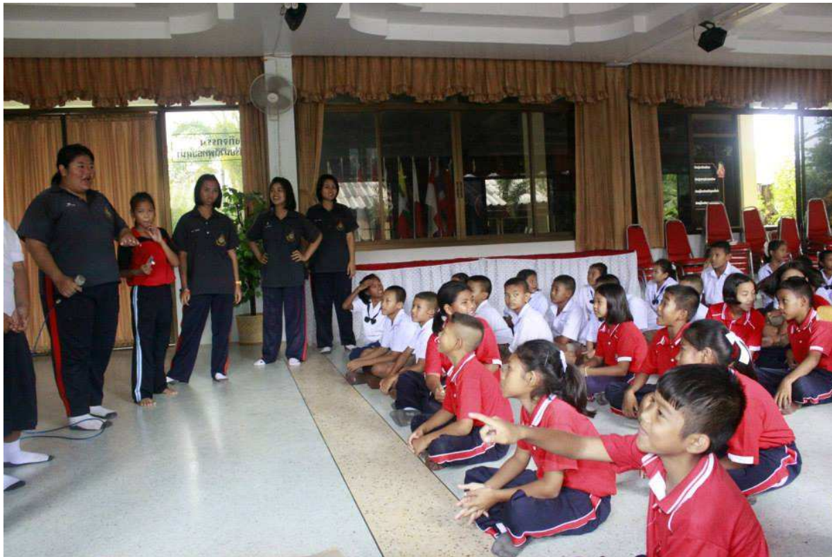
ทำความเข้าใจกับน้องๆ