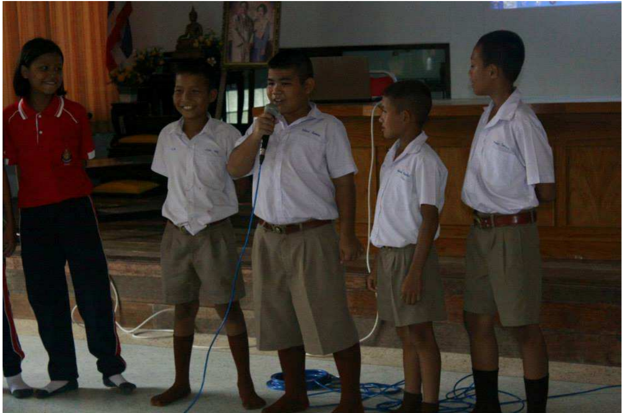
น้องแสดงความคิดเห็นเกี่ยวกับอาเซียนคืออะไร