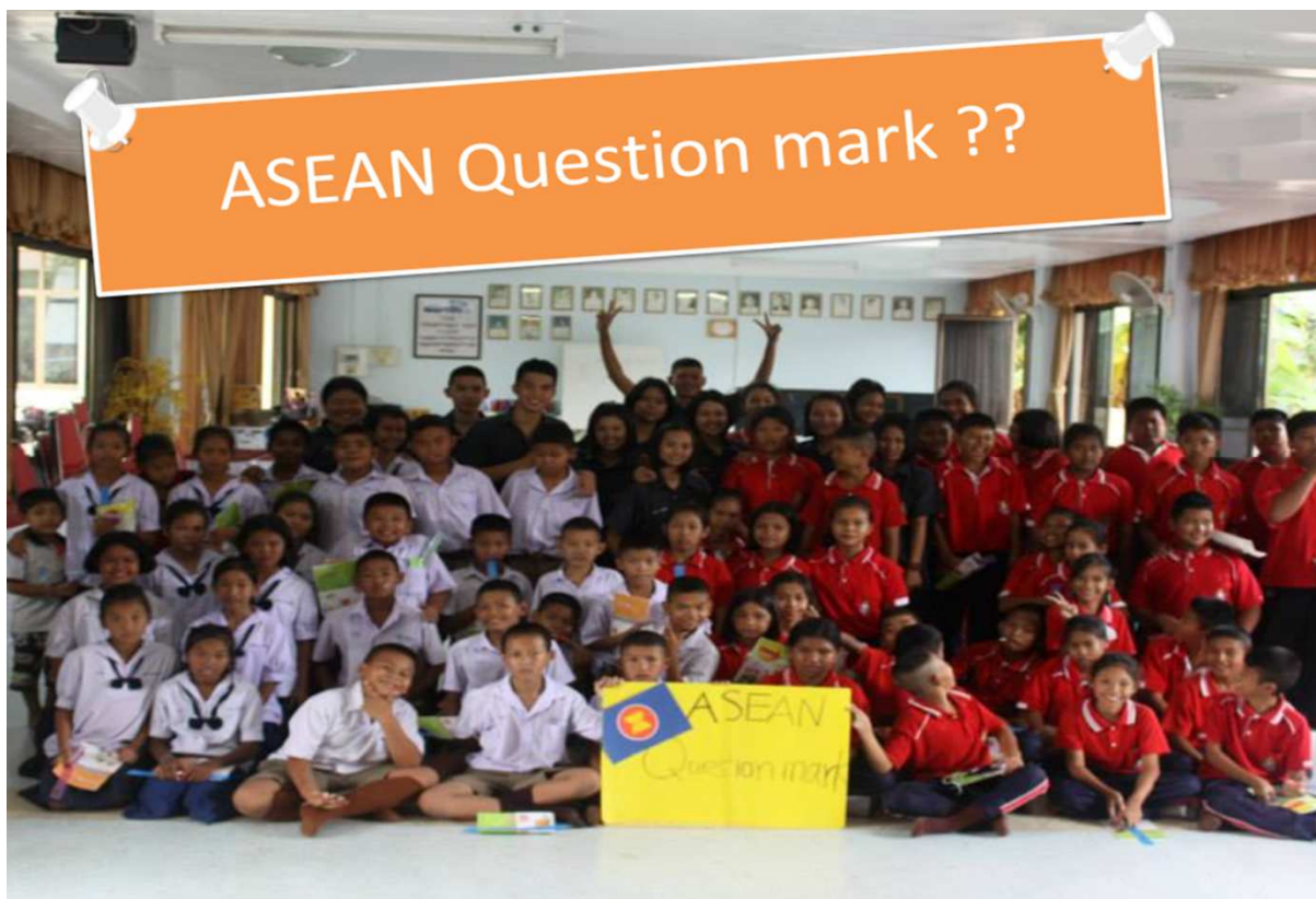
งานนำเสนอ สรุปโครงการ ASEAN QUESTION MARK ?