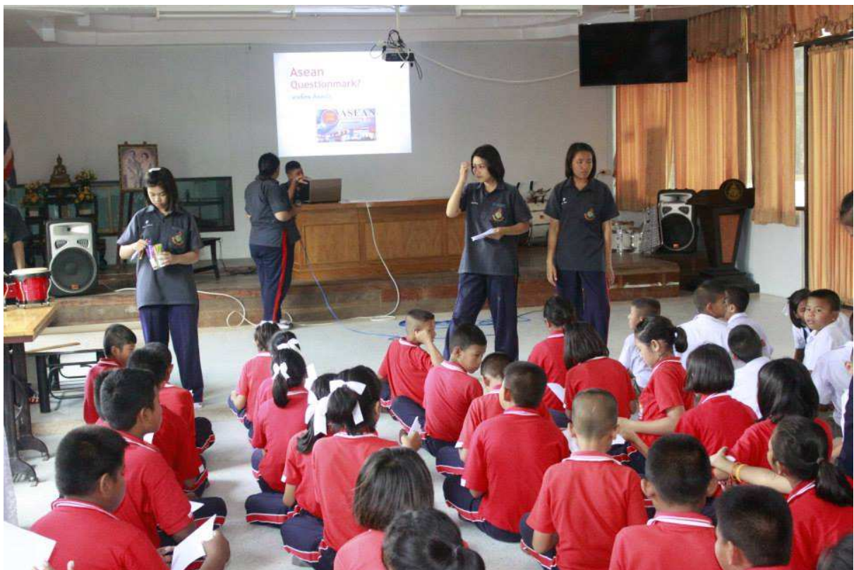
มอบความรู้เรื่องอาเซียนให้แก่น้องๆ