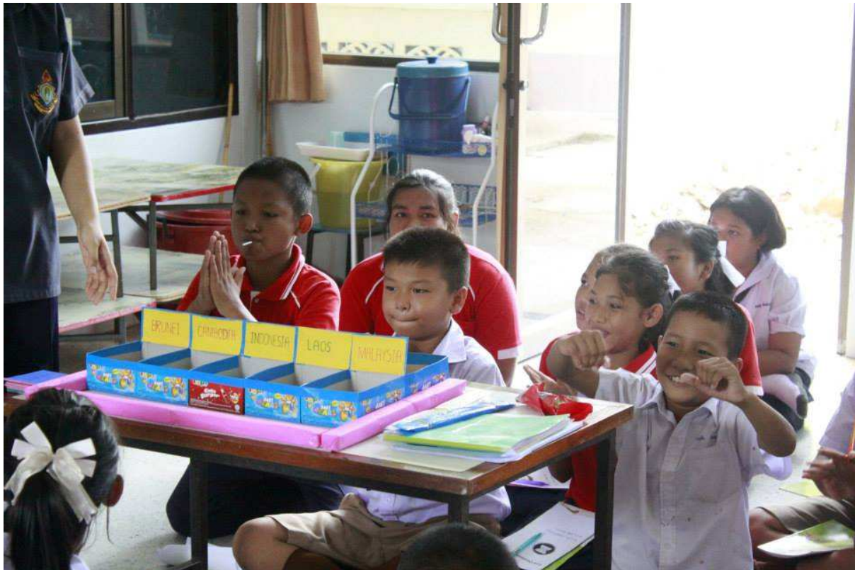
น้องๆเล่นเกมเกี่ยวกับอาเซียน