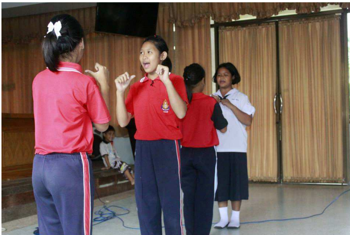
กิจกรรมทำความเข้าใจ