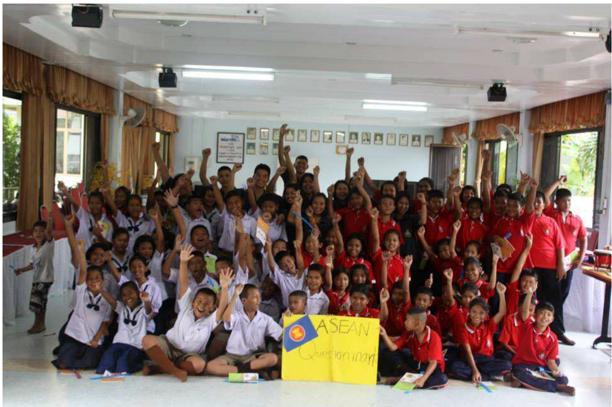
ปิดโครงการ ASEAN QUESTION MARK ?