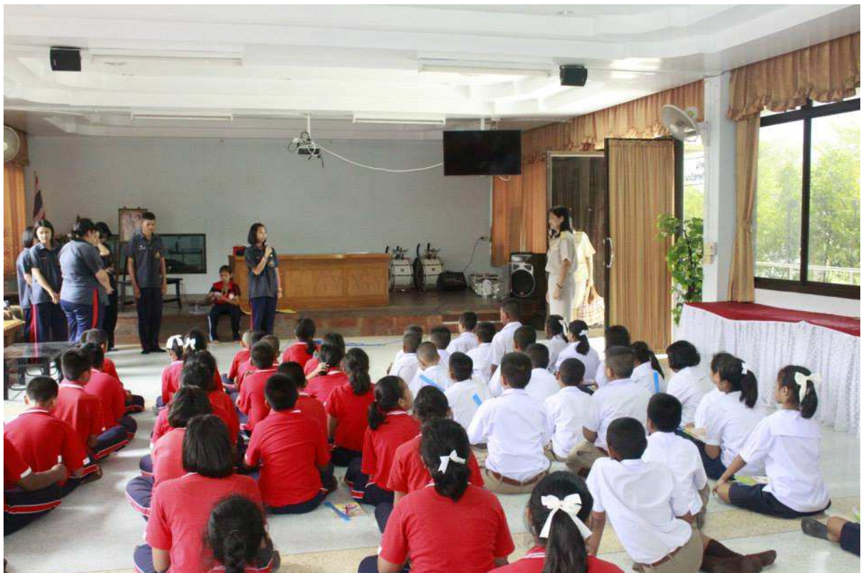
กล่าวเปิดโครงการ ASEAN QUESTION MARK ?