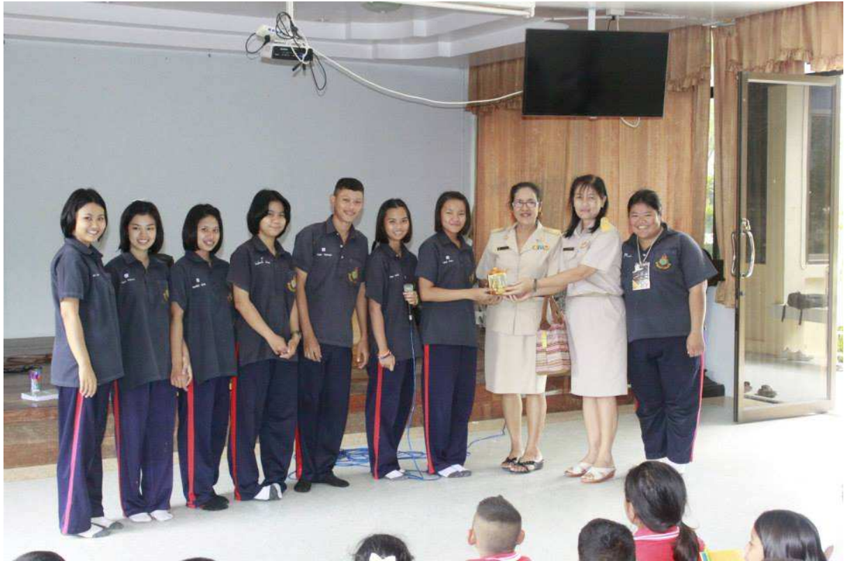
ขอขอบคุณสถานที่ โรงเรียนวัดบ้านทวน