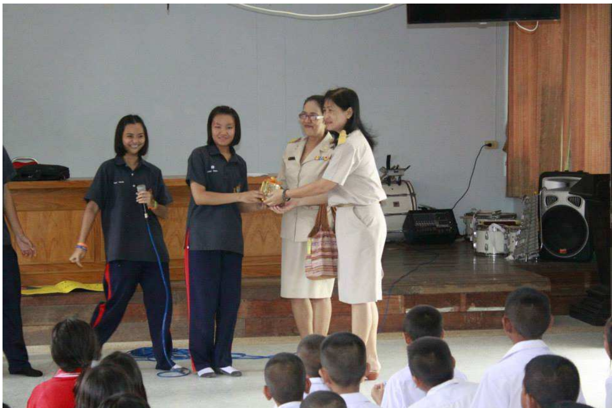
มอบของที่ระลึกแก่ครู