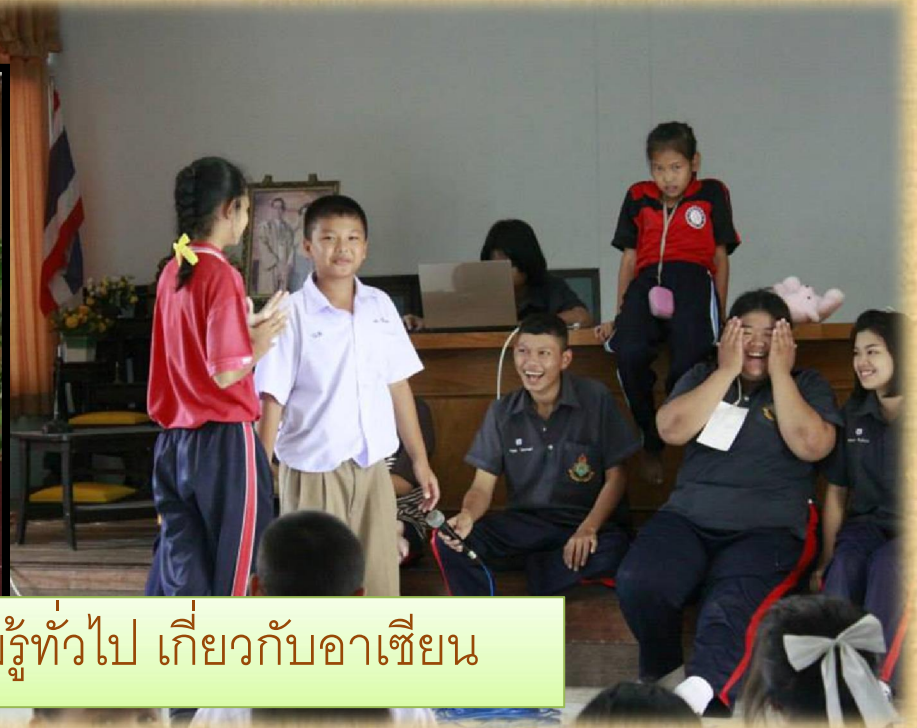
ตอบคำถามความรู้ทั่วไป เกี่ยวกับอาเซียน