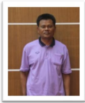
นายนาง หมอบทองกลาง(4/12) กรรมการ