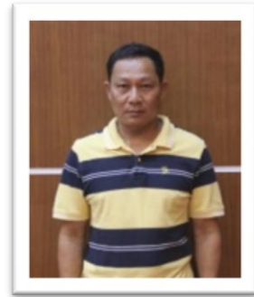
นายสนธยา (4/4) กรรมการ