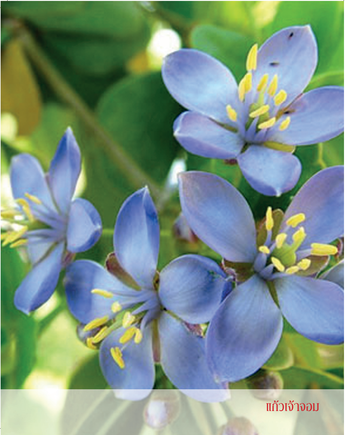
แก้วเจ้าจอม